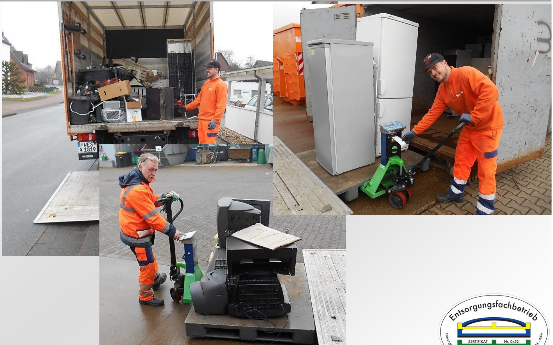
Fachtagung "Zu Schade zum Wegwerfen" 10.11.2017