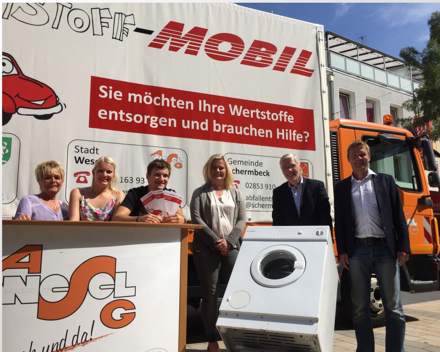
Fachtagung "Zu Schade zum Wegwerfen" 10.11.2017